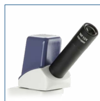
Digitalen Monokular Kopf