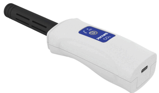
Cobra SMARTsense CO2