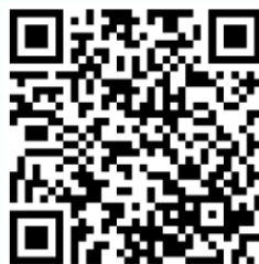
measureAPP für iOS Betriebssysteme