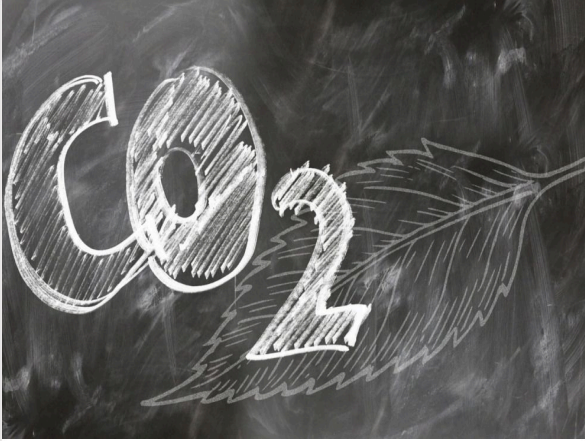
CO 2 dans la salle de classe

Dans la plupart des heures de cours, et comme tu le sais certainement aussi, il y a quelqu'un qui crie : "Mais ouvre la fenêtre. Je commence à m'endormir !", ou un nouveau professeur entrant dans la salle qui avant le "Bonjour" prononce un "Ouvrez toutes les fenêtres immédiatement !".