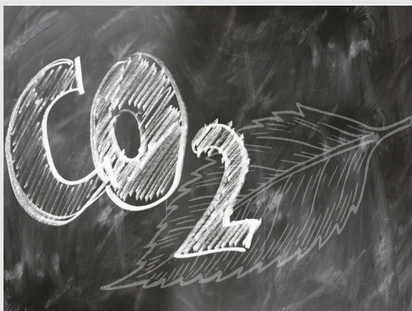
CO 2 dans la salle de classe

Du dioxyde de carbone (CO 2 ) fournit du matériel de discussion pour plusieurs heures de cours en ces temps actuels. L'accent est mis ici sur l'accélération du changement climatique à cause du CO 2 ainsi que sur la réduction des émissions de CO 2 .