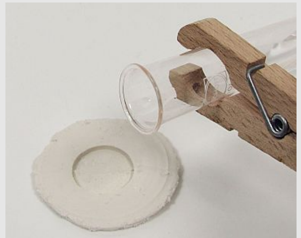
Negativbild einer Münze