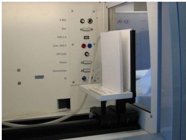
Abb. 2: Aufbau im Experimentierraum

Wenn Sie die Wirkung des Kontrastmittels photographisch dokumentieren möchten, verfahren Sie am besten wie in P2542001 angegeben.