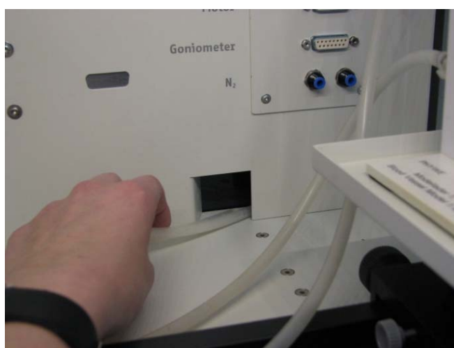
Abb. 3: Schlauchführung