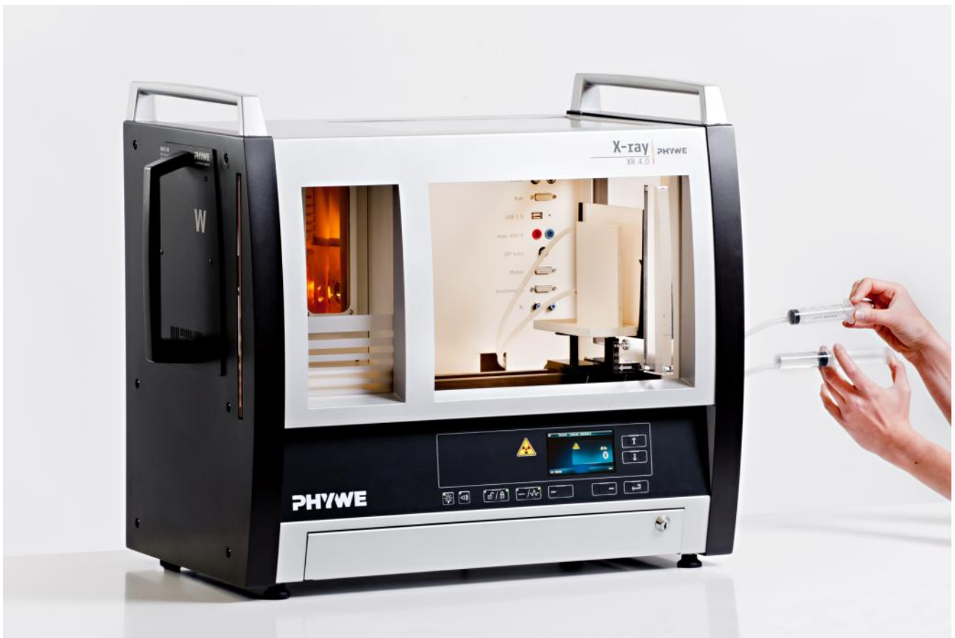
Abb. 1: P2541901

Dieser Versuch ist in dem Erweiterungsset XRI 4.0 X-ray Radiografie enthalten.