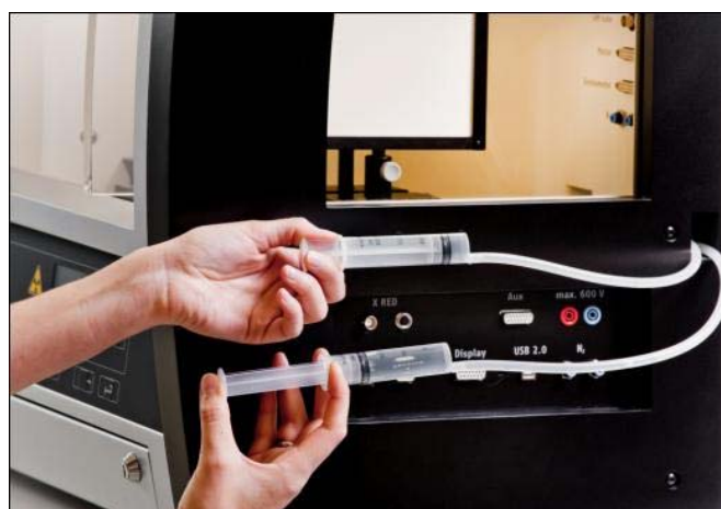
Abb. 4: Durchführung