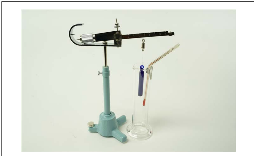
Abb. 1: Dichtwaage nach Mohr