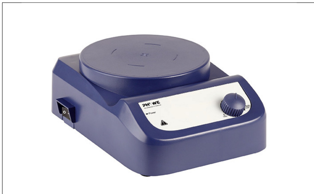
Abb. 1: 35761-99 Magnetrührer ohne Heizung