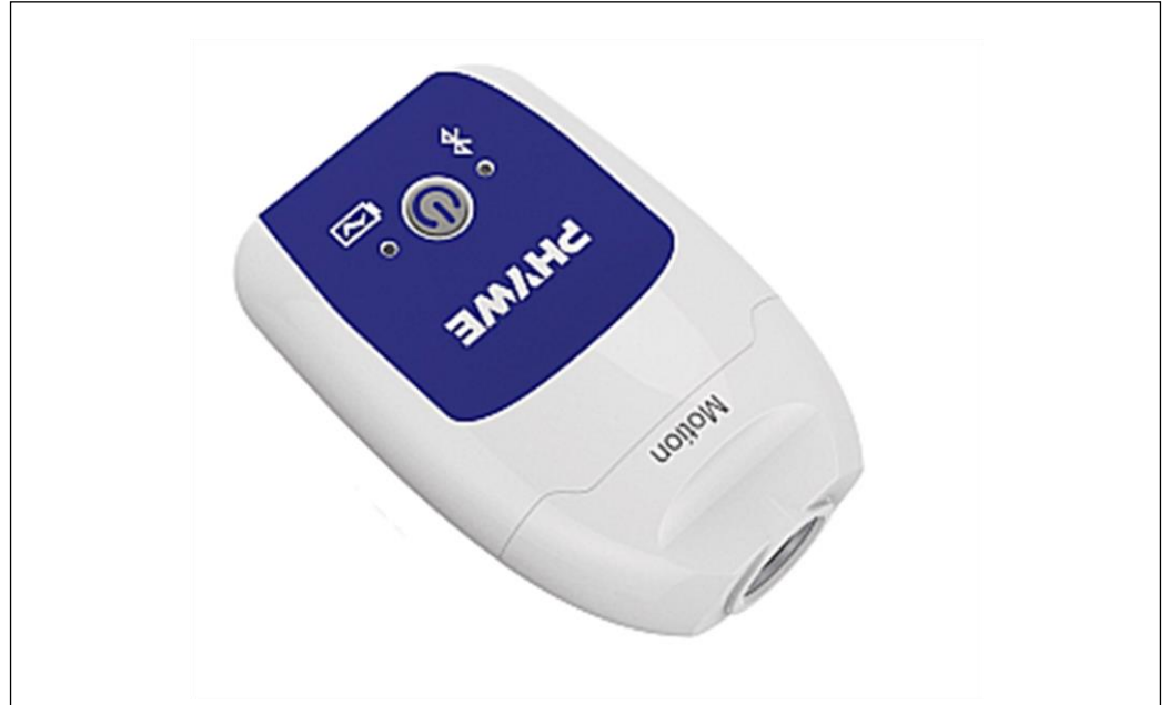
Kuva 1: 12908-01 Cobra SMARTsense liikeanturi

Yksikkö on sovellettavien EY:n suunta- viivojen mukainen.