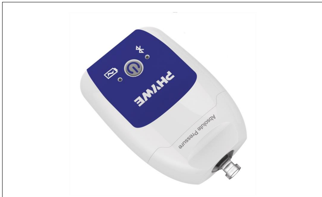
Kuva 1: 12905-01 Cobra SMARTsense Pressure 0.... 400 kPa

Yksikkö on sovelletta- vien EY:n suunta- viivojen mukainen.