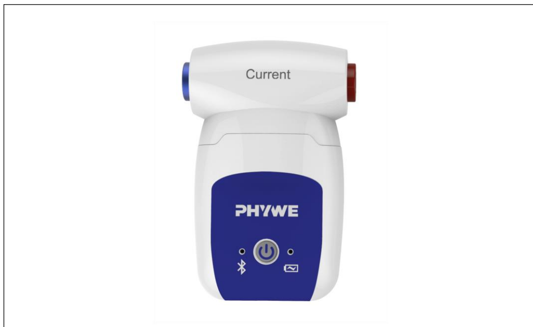
Kuva 1: 12902-01 Cobra SMARTsense -virta ±1 A

Yksikkö on sovelletta- vien EY:n suunta- viivojen mukainen.